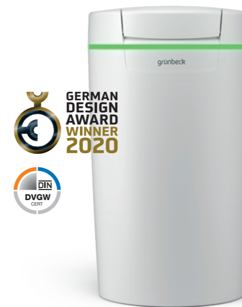
Installation d'adoucissement softliQ:MD