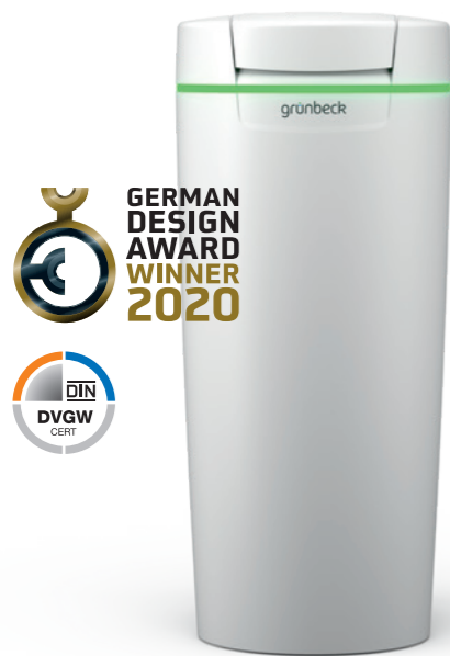
Installation d'adoucissement softliQ:SD

Avec les nouvelles installations softliQ, bénéficiez de l'étendue complète des prestations. Toutes les tailles d'installation sont équipées d'un nouvel écran tactile. Celui-ci vous garantit le confort d'une utilisation intuitive. Votre adoucisseur anticipe les besoins : grâce à un émetteur de lumière infrarouge, l'adoucisseur softliQ mesure la hauteur de remplissage du bac à sel et vous rappelle le cas échéant qu'il faut faire un nouvel appoint. Vous êtes informé en permanence – par l'écran, via l'application myProduct de Grünbeck ainsi que, si vous le désirez, par E-mail. Pour encore plus de sécurité pour votre logement, le capteur d'eau intégré surveille les fuites d'eau incontrôlées sur le lieu d'installation de l'appareil.